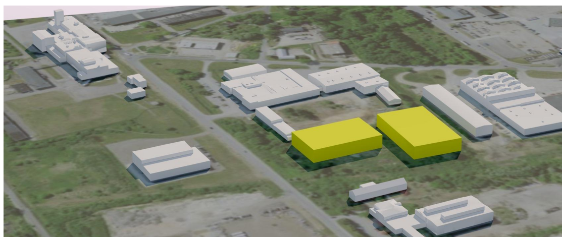
Vaade planeeritavale alale kirdest maksimeeritud hoonemahu paiknemisega