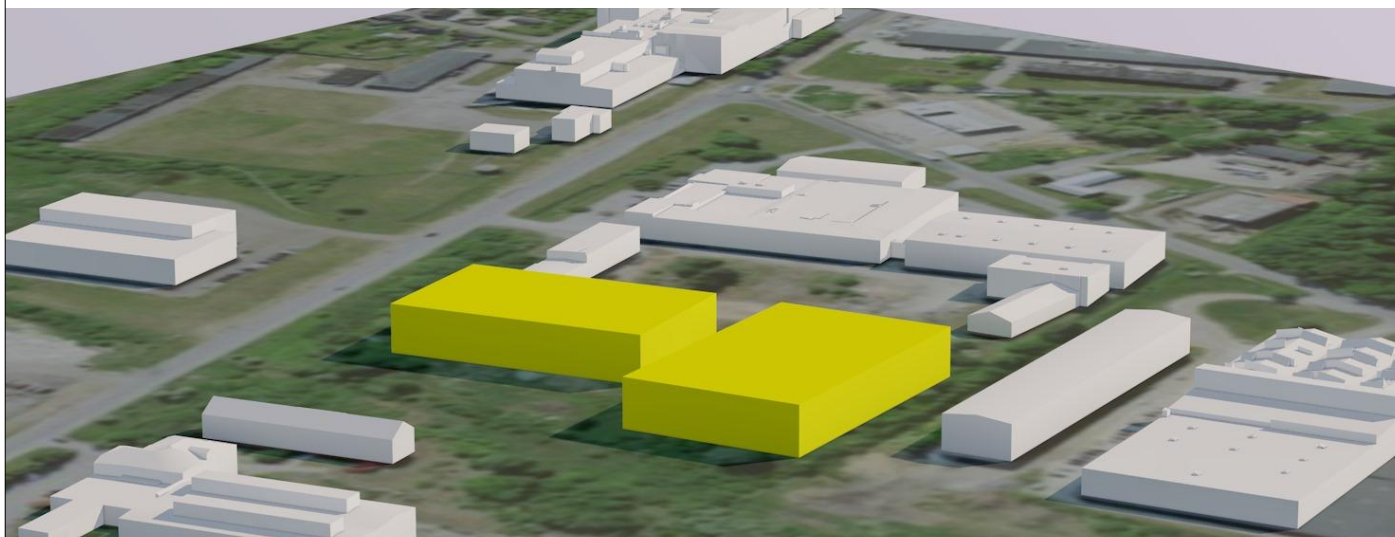
Vaade planeeritavale alale loodest maksimeeritud hoonemahu paiknemisega